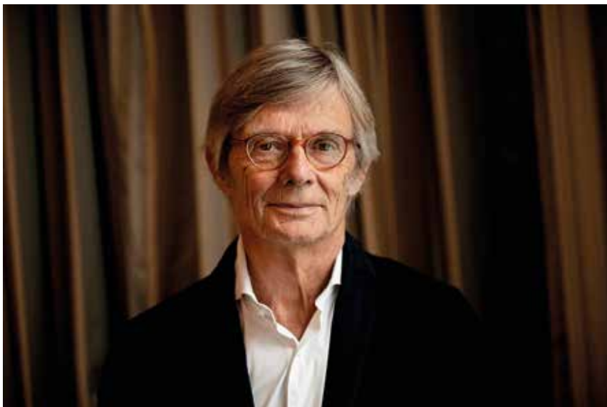
Bille August.